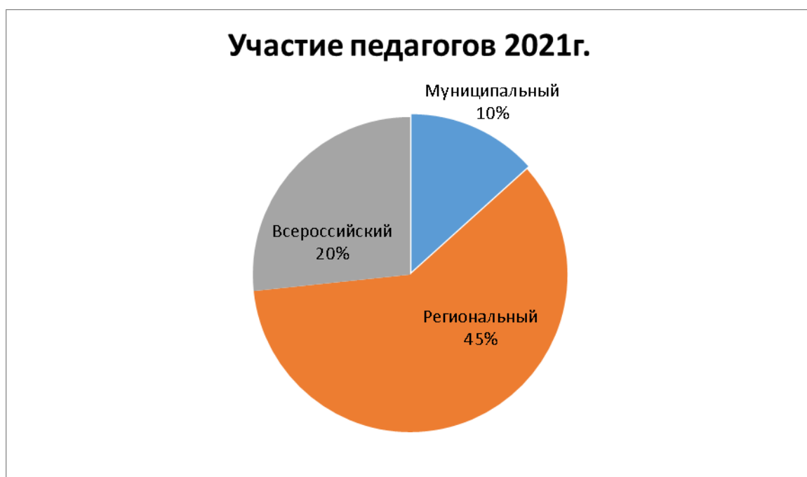
Участие педагогов - 2021г.